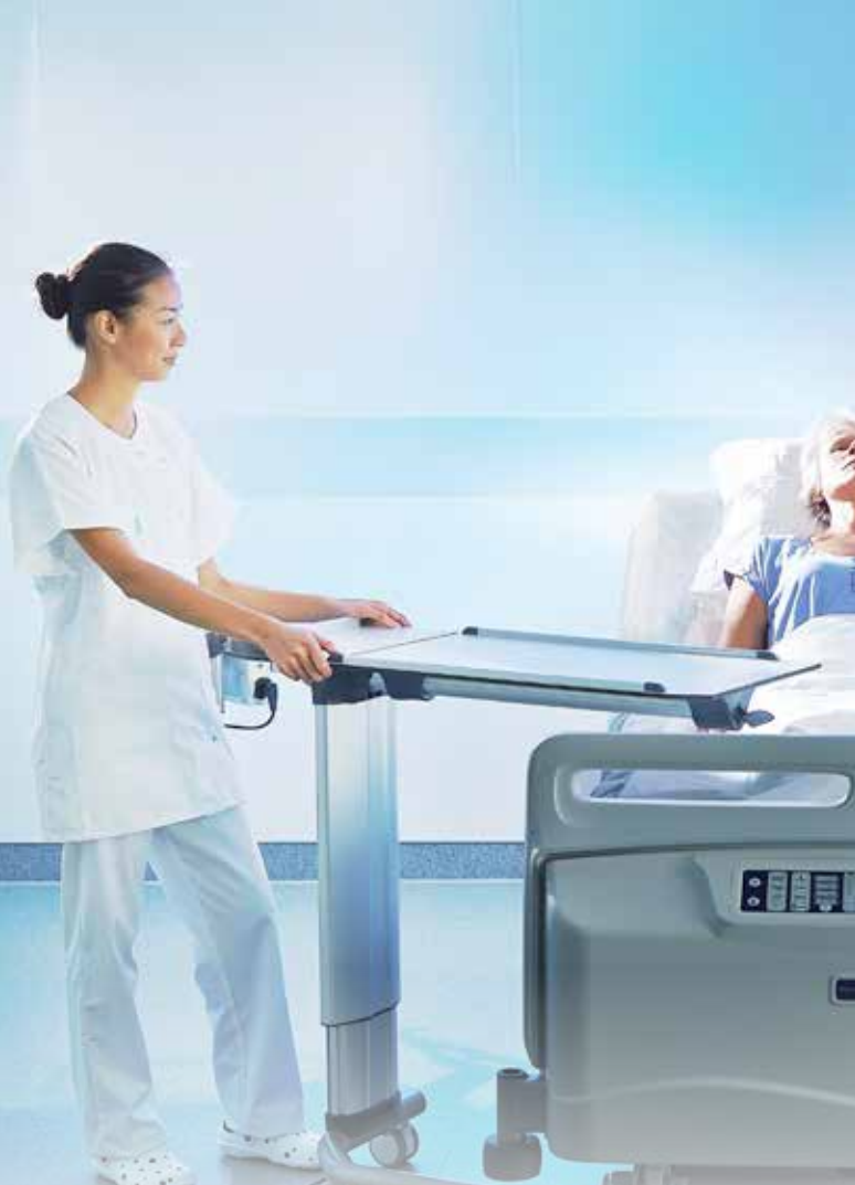
HIGHCARE- EN REGULIERE AFDELINGEN