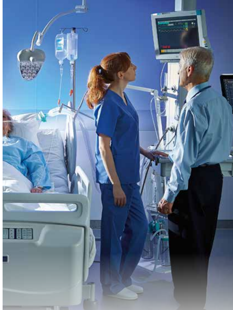
INTENSIVE CARE- AFDELINGEN