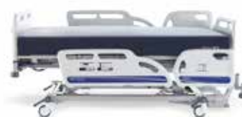
CITADEL PLUS Bedframe voor zwaardere zorgvragers